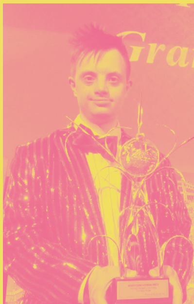
Eros amb el Premi «Humanidades»